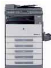
Corpo macchina + Alimentatore originali + 4 cassette carta + bypass