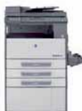
Corpo macchina + Alimentatore originali + 2 cassette carta + bypass