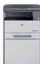
Corpo macchina + Alimentatore originali + Supporto mobile base