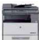
Corpo macchina + Alimentatore originali